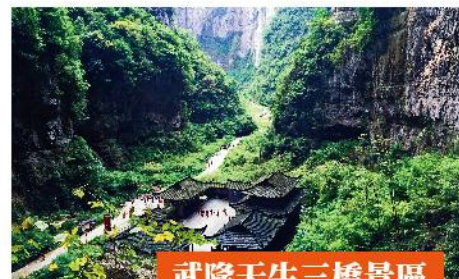
武隆天生三橋景區