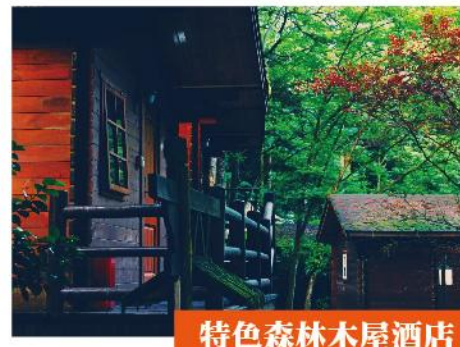
特色森林木屋酒店